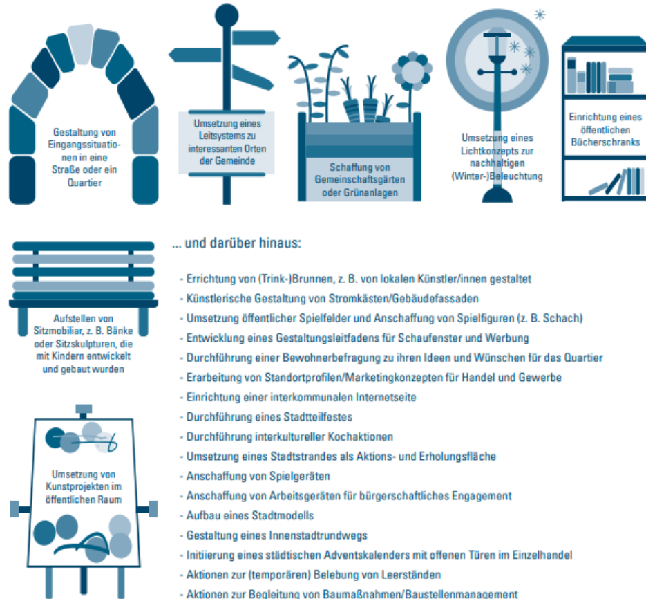
Abbildung 1: Projektideen Verfügungsmittel. Quelle: BBSR 2020, S. 30.

Projektideen: Beispiele und Anregungen aus der bundesweiten Praxis